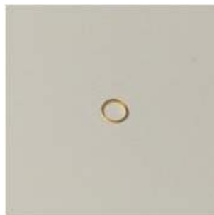
< 물품 이미지 >