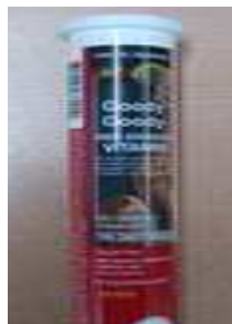
< 물품 이미지 >