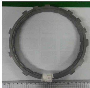
< 물품 이미지 >