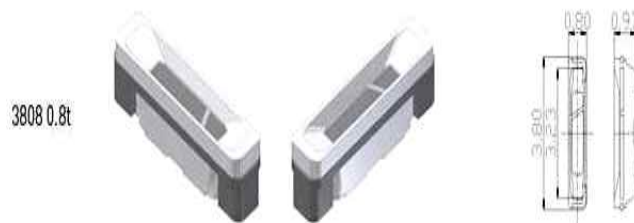
< 물품 이미지 >