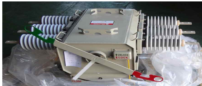
< 물품 이미지 >