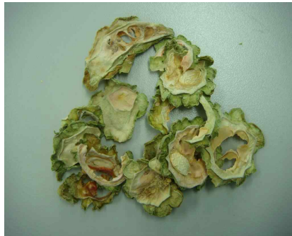
< 물품 이미지 >