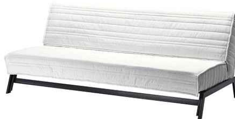
< 물품 이미지 > < 프레임과 매트리스 위에 커버(본건 물품)를 결합한 모습 >