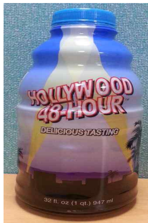
< 물품 이미지 >