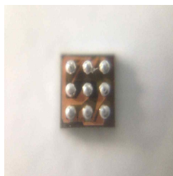
< 물품 이미지 >