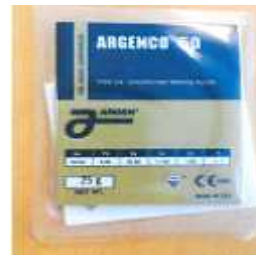
< 물품 ① 이미지 및 소매포장 모습 >