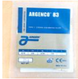
< 물품 ② 이미지 및 소매포장 모습 >