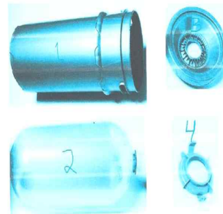
< 용기의 구성 요소 >