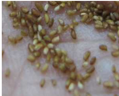
< 물품 이미지 >