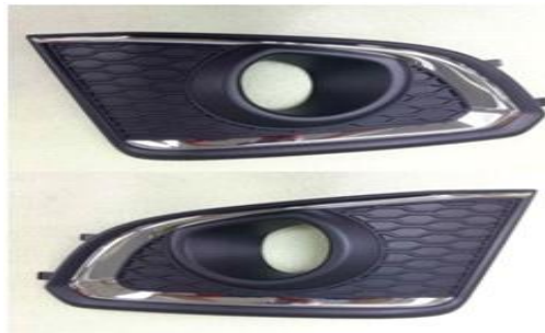
< 물품 이미지 >