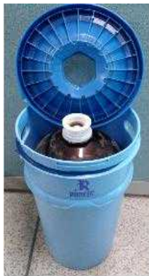
< 물품 이미지 >