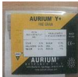
< 물품 ③ 이미지 및 소매포장 모습 >