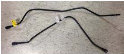
< 본건 물품 이미지 >